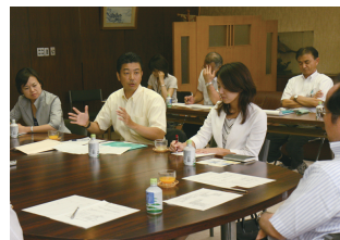
市長に意見を述べる前回の参加者