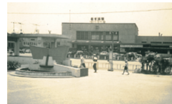
昭和35年ごろの佐世保駅前

右下の写真は、バスの発車後、運転席の横から窓ガラス越しに国道35号周辺を写したものです。このころの市バスには、まだ車掌が乗っていました。国道の拡張工事は昭和30年に竣工しましたが、まだ今ほど交通量も多くなく、沿道の建物もコンクリート造りのビルはあまり見られないようです。