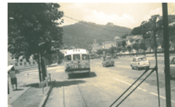
国道35号（常盤町付近）

【懐かしい佐世保の写真をお寄せください】 写真にまつわるお話と住所、氏名、電話番号を書き、「思い出の一枚」担当あてと明記してください。