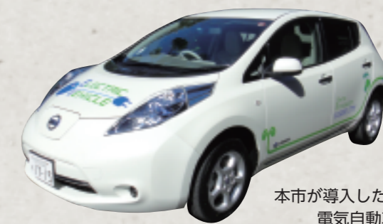
本市が導入した電気自動車

※各会場とも、展示時間は8時30分から17時15分まで。最終日だけ午前中までの展示となります。