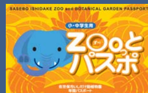
大好評のお得な年間パスポート券！

〒857-1231 船越町2172 ☎28-0011 開園時間=9時～17時15分 入園料=高校生以上400円、中学生以下100円(保護者が同伴する6歳未満の幼児は無料) ※市営バス一日乗車券利用の場合は2割引。