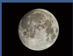
ことしの中秋の名月は9月14日

〒857-0025 熊野町261 ☎23-1517 開館時間=9時～17時 休館日=火曜、祝日