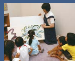
毎週土曜は「おはなし会」開催

〒857-0026 宮地町3-4 ☎22-5618 開館時間=10時～18時(金曜は一般室のみ10時～20時) 休館日=月曜、祝日(月曜の場合は翌日も)、月末(月曜の場合は前日も)。早岐・相浦・世知原・宇久地区公民館図書室も同様。