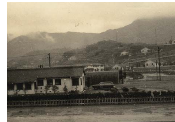
昭和29年の常盤町付近

写真にまつわるお話と住所、氏名、電話番号を書き、「思い出の一枚」担当あてと明記してください。