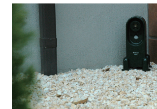
猫のふん害を軽減するという機械

本市では、超音波で猫の侵入を防ぎ、ふん害を軽減する機械を、市民の皆さんに効果を確認していただくため無料で貸し出しています。貸し出し期間は10日間で、貸し出しを希望する人は、身分が証明できるものと印鑑を持参の上、保健所3階・生活衛生課までお越しください(事前にご連絡を)。