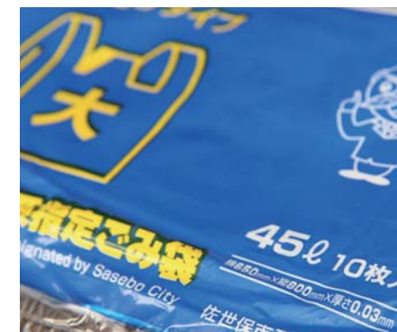
厚さ0.03mmの指定ごみ袋(45ℓ手提げ用)

また、現在、ごみ処理券制度の見直し作業を行っており、その中でも指定ごみ袋の強度等について再度検討しています。