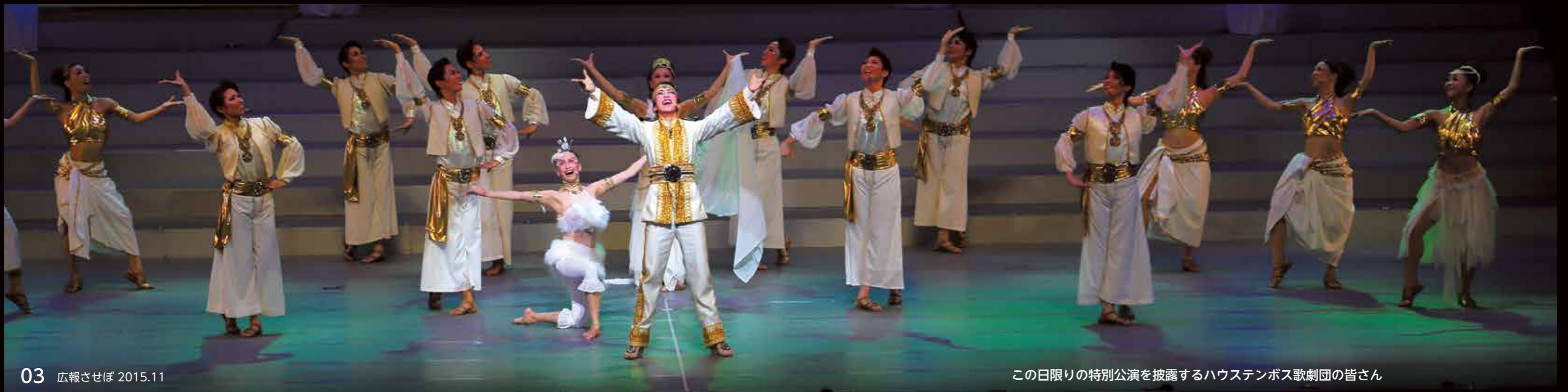
この日限りの特別公演を披露するハウステンボス歌劇団の皆さん