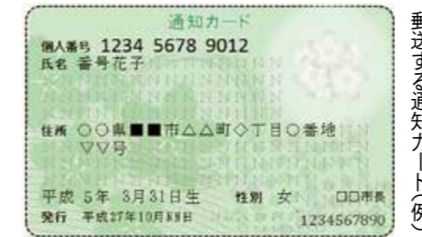
郵送する通知カード(例)

11月末までに、簡易書留で「通知カード」「個人番号カード交付申請書」「返信用封筒」「説明書」を郵送します。次のいずれかの方法で申請してください。個人番号カードは初回だけ無料で取得することができます。