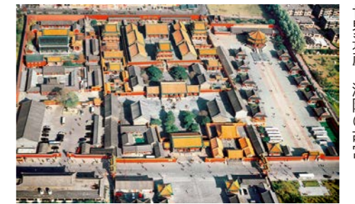
世界遺産・瀋陽の故宮

本市と中国・瀋陽市との友好交流都市提携5周年を記念し、市長と瀋陽市を訪問する市民訪問団の参加者を募集します。