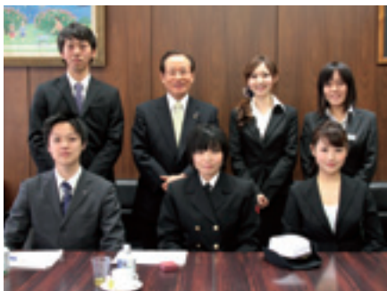
第3回「新社会人と佐世保市のまちづくりについてトーク」参加者の皆さん

応募方法 応募用紙に必要事項を記入し、①郵送〒857の8585(住所不要)②ファクス25・2184③Eメール hishok@city.sasebo.jp のいずれかで秘書課へ