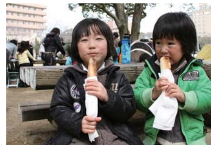
パン作りに挑戦した後、焼き上がったパンをおいしそうに食べる子どもたち(昨年度)