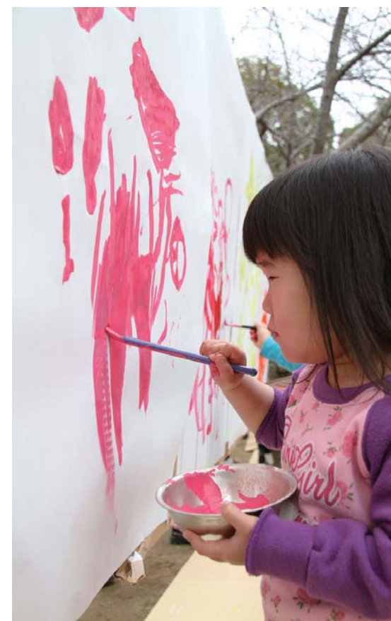
大きな模造紙に向かって熱心に絵を描く子ども(昨年度)