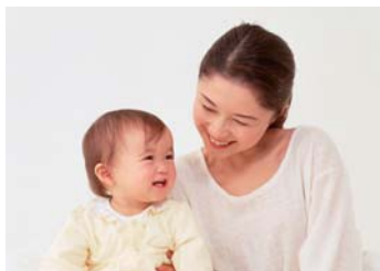
④健康づくり課(①~⑥) ⑤子ども保健課(⑦)