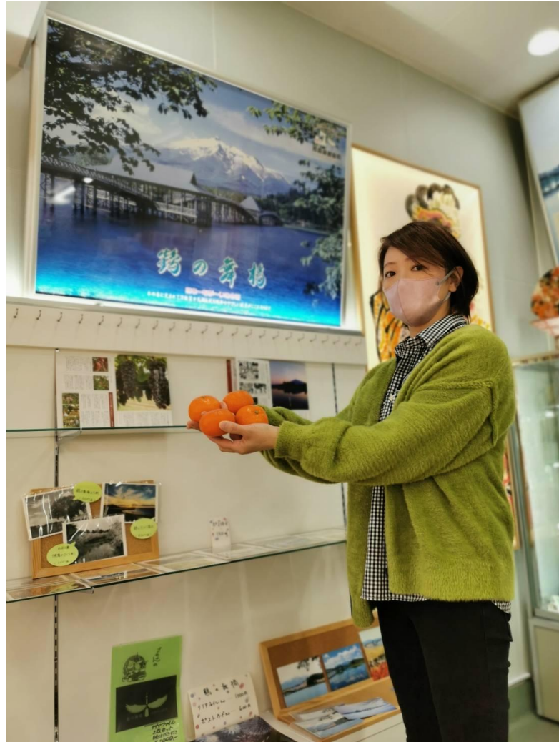
ここにもあるじゃ（鶴田町）