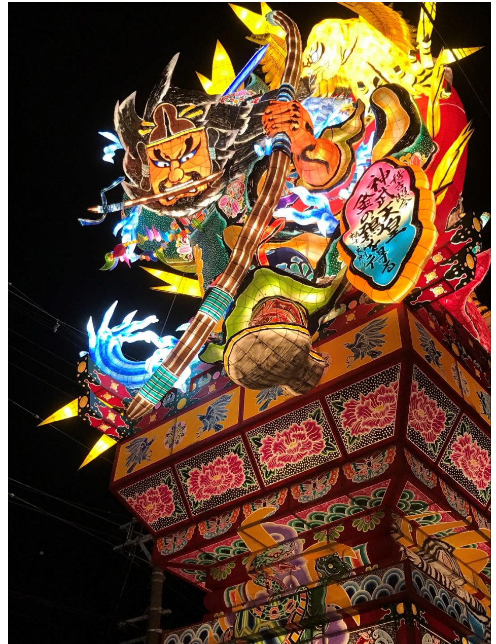
福士裕朗氏作 「稽古照今・神武天皇、金の鵄を得る」

大正時代に一度途絶えましたが、平成8年に復元、平成10年より市内運行が復活しました