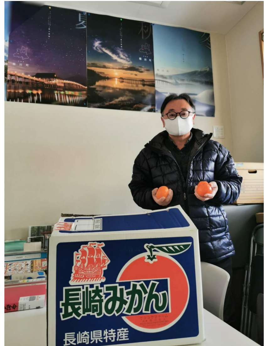
ここにもあるじゃ（鶴田町）