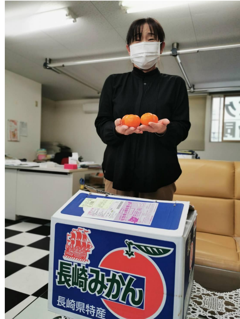
五所川原ライオンズクラブ事務局