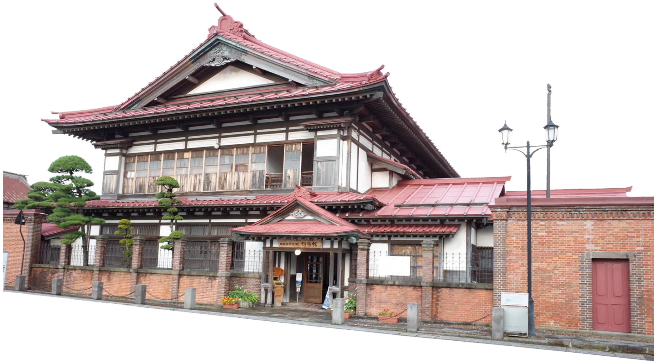
太宰治の生家「斜陽館」