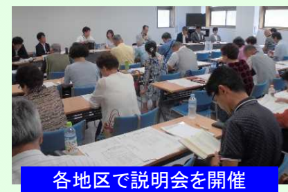
各地区で説明会を開催