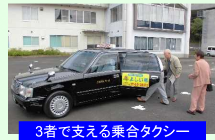
3者で支える乗合タクシー